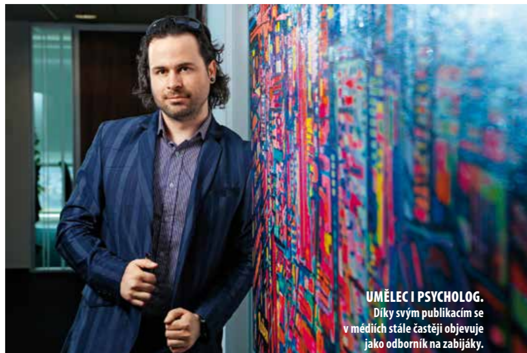
UMĚLEC I PSYCHOLOG. Díky svým publikacím se v médiích stále častěji objevuje jako odborník na zabijáky.

Když jste před dvěma lety vytvořil nový design pro BMW, některá média v Asii a Americe vás podezírala, že tvoříte pod vlivem LSD. Možná tak působí spojení konzervativního vozu se spontánní a divokou malbou. Navíc zde fungují předsudky, že všichni umělci jsou od rána do večera zfetovaní. Stejně myšlenky se objevily i u Andyho Warhola, který stejně jako mnoho jiných výtvarníků v dějinách vytvořil z BMW umělecké dílo. Tam se možná média trefila. Já ale fakt pod vlivem nebyl. Nepotřebuji žádná aditiva. Tuning přichází sám, možná i prostřednictvím mých dalších profesních světů.