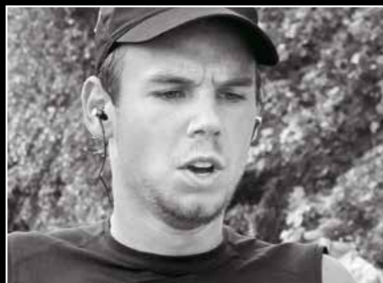
KDYŽ VRAŽDÍ DEPRESE. Andreas Lubitz měl prestižní místo, uznání společnosti, i skvělý plat. Přesto nasměroval letadlo se 149 pasažéry do horského masivu francouzských Alp.

S vaší otázkou souvisí ještě jeden fenomén. Když například v roce 2012 došlo k masové vraždě na americké základní škole Sandy Hook, tak tato zpráva byla druhou nejsledovanější informací hned po prezidentských volbách. Všichni měli mnoho informací, ale lišila se reakce na ně v závislosti na míře blízkých emocí a přesahu vysvětlení. Zatímco v okolí se