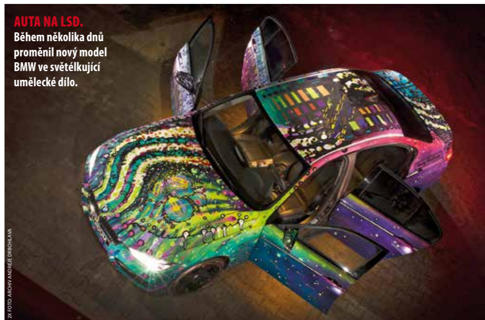
AUTA NA LSD. Během několika dnů proměnil nový model BMW ve světélkující umělecké dílo.